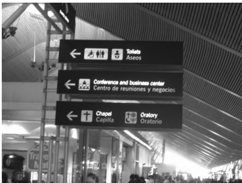
T4 Indicador oratorios

lica que lleva el nombre de la Virgen de Guadalupe. En ella podemos ver un cartel con los aeropuertos europeos donde hay servicios religiosos con su número de teléfono o fax. También figura el horario de la celebración de la eucaristía las capillas católicas del aeropuerto.