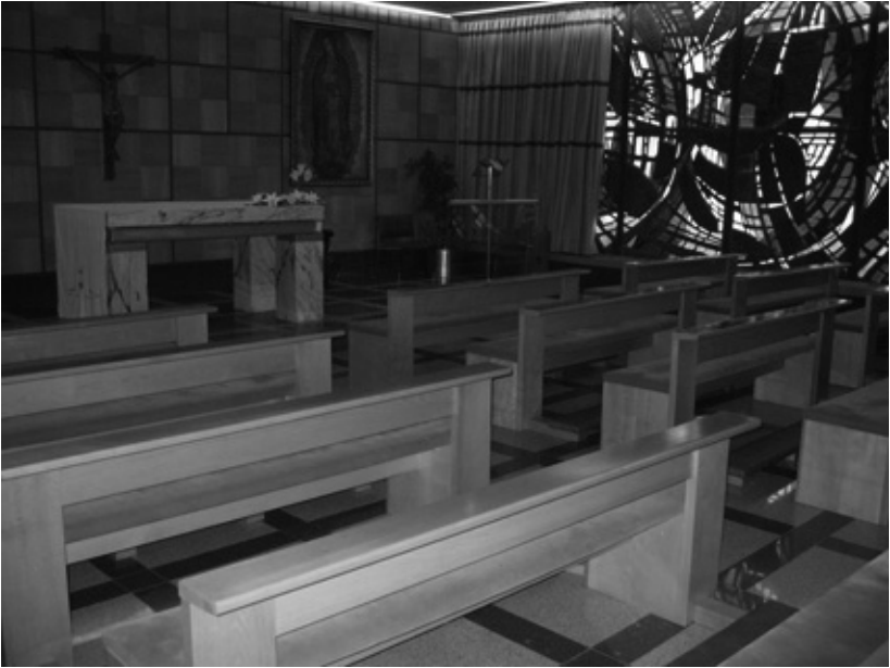
T1 Capilla Virgen de Guadalupe

y también se ha escrito mucho. Y, sin embargo, nunca es lo suficiente porque el trabajo de sensibilización y mentalización es muy lento ya que el diálogo interreligioso tiene que reobrar sobre la actitud del propio creyente respecto de la propia religión y de las otras creencias religiosas.