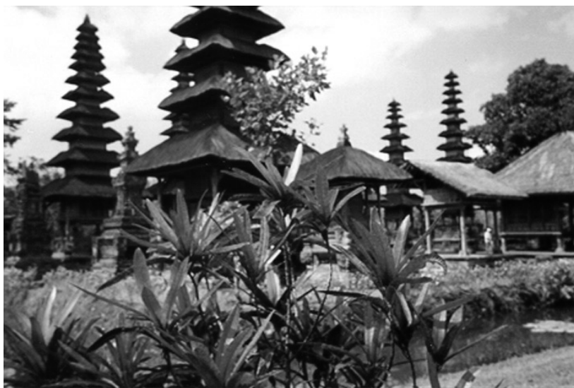
Templo Real de Ayun, en Mengwi, Bali