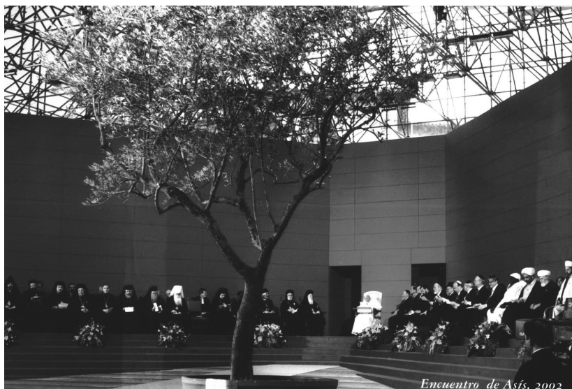
Imagen del calendario de las religiones

acompañando a una hermana mía que estaba muy grave. A la mañana siguiente, día de la Natividad del Señor, voy a desayunar; la cafetería en ese momento estaba cerrada. También otras personas esperaban. Cuando la señorita encargada abre la puerta, uno de los presentes saluda con la alegre frase 'Feliz Navidad', a cuyo saludo responde: «eso será para los católicos, no para los musulmanes». Y otro del grupo interviene desenfadadamente y como quien no dice nada: «¡Hombre!, estamos en un mundo en el que ya son muchas las religiones que nos rodean y están con nosotros. Sabemos que todas ellas tienen sus expresiones de saludo. Y como todas, cuando te saludan, desean bienestar, paz, salud y felicidad, me agrada que me saluden de esa manera aunque no sea mi religión o no crea en ninguna».