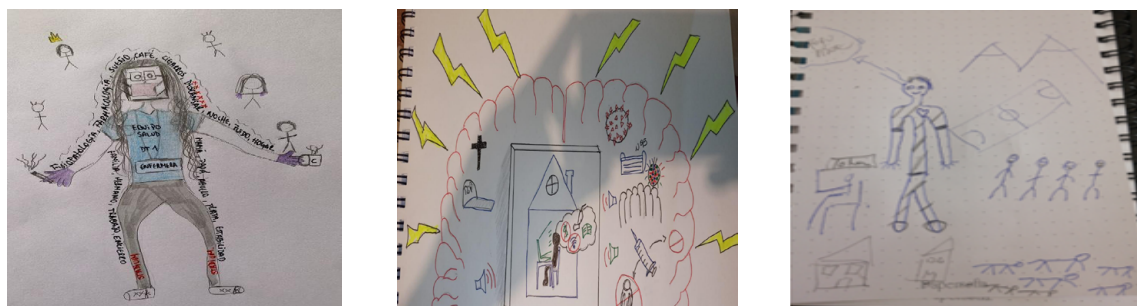
Figura 3a, 3b y 3c: Cartografía corporal de la participante “Mujer DT”, “hombre rayos” y “hombre montaña”

Leyenda: mujer directora técnica (DT) se identifica por la vestimenta deportiva, hombre rayos se le atribuye el sobrenombre a los rayos amarillos que aparecen en los laterales y la parte superior de la cartografía, mientras que el seudónimo de hombre montañas se deriva de la relevancia que tienen las montañas para el participante.