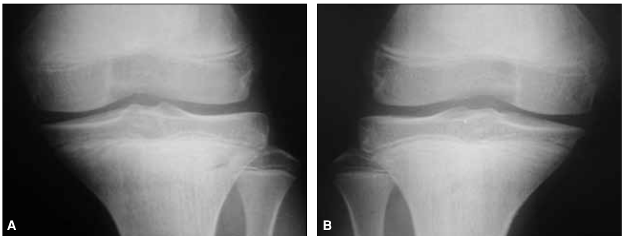
Figura 2. Radiografías de frente de ambas rodillas que muestran las placas fisarias abiertas. Corresponden a un niño de 12 años, según el atlas de Pyle y Hoerr.