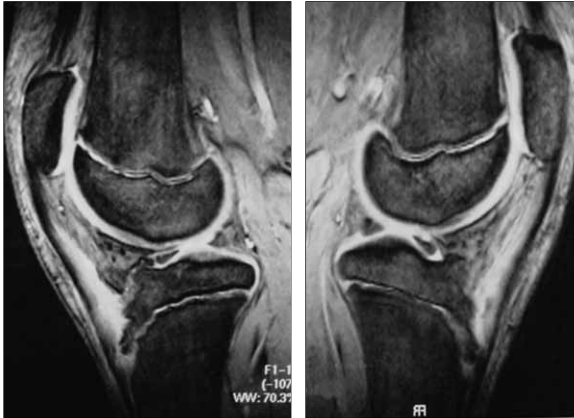
Figura 4. En la resonancia magnética se aprecia el edema alrededor de la tuberosidad anterior de la tibia. Las placas epifisarias aún permanecen abiertas.

suele identificarse una prominencia cartilaginosa u ósea. El dolor se exagera con la extensión contra resistencia desde la posición de flexión.