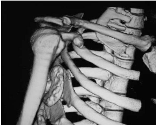
Figura 2. Tomografía computarizada tridimensional. Vista escapulotorácica.