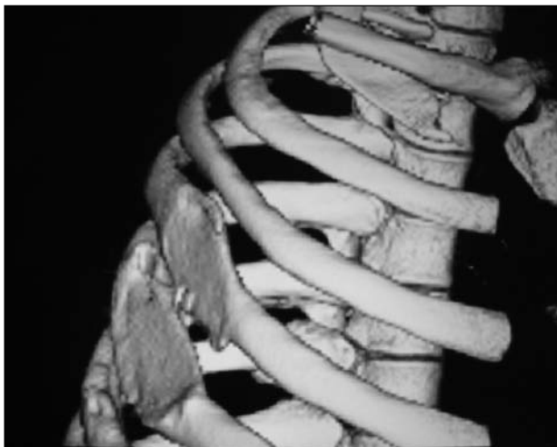
Figura 3. Vista de la impronta en la parrilla costal.

de gruesas capas musculares y es aquí donde pequeñas exostosis pueden generar sutiles fricciones.