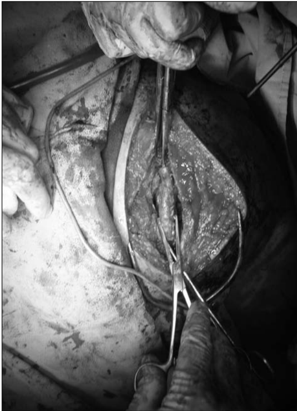
Figura 6. Extracción del tumor.