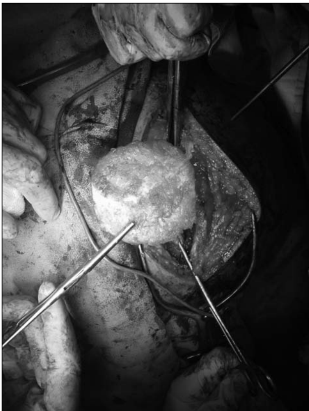
Figura 7. Extracción del tumor.

del ángulo superomedial, conocido como tubérculo de Lushka y presente en el 6% de las personas, puede predisponer a la bursitis con crujido doloroso. 4,8