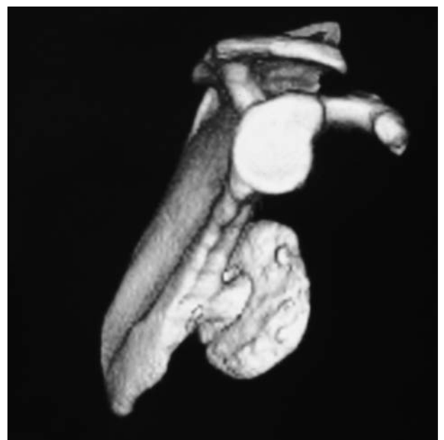
Figura 1. Tomografía computarizada tridimensional. Vista lateral.

En condiciones normales, la escápula se desliza sobre la pared del tórax; la superficie ondulada de este se torna regular y está amortiguada por dos planos musculares, el serrato por parte del tórax y el músculo subescapular en la escápula. Los bordes de este hueso están desprovistos