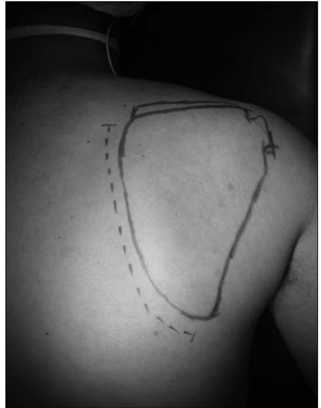
Figura 4. Vía de abordaje.

Estas estructuras pueden generar crujido con los movimientos escapulotorácicos en forma secundaria a una inflamación debida a traumatismos o movimientos repetitivos. Si bien no se ha demostrado una relación casual en su génesis, se especula que una alteración de la forma