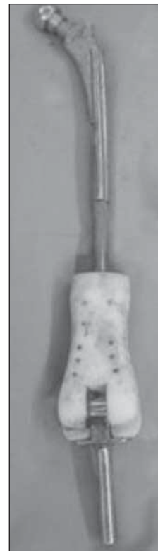
Figura 2. Vista posterior del megaespaciador artesanal. Se observa que el segmento distal es una megaprótesis de fémur distal, el segmento medio es un grueso clavo trebolado de Kunstcher que primero se encastró a presión en el tallo de la megaprótesis y luego de decidir el largo correcto, a proximal se encastró en las canaletas anterior y posterior de la prótesis de Müller autobloqueante. El montaje se reforzó con lazadas de alambre y todo el cuerpo de la prótesis y el clavo se cubrieron con cemento con antibiótico.

Luego de resecado el fémur se confeccionó el megaespaciador, según las mediciones preoperatorias, con elementos protésicos recuperados del banco de prótesis del servicio. Para la parte proximal, se optó por una prótesis de cadera de tipo Müller autobloqueante con una cabeza de 28 mm de diámetro y una prótesis no convencional de fémur distal con rodilla articulada para la sección distal. Ambos componentes fueron vinculados con un clavo de Kunstcher endomedular en sus extremos a un clavo endomedular, estabilizándose el sistema con lazadas de alambre (Fig. 2).