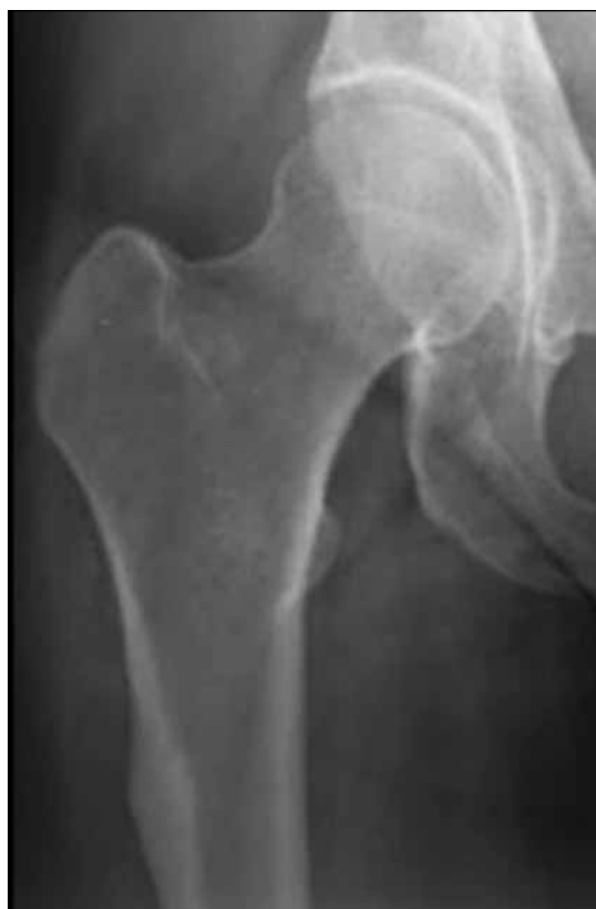
▲ Figura 1. Radiografía de cadera derecha, de frente. Se observa el característico engrosamiento de la cortical externa por consumo crónico de bifosfonatos. Lamentablemente dicha anomalía suele pasar inadvertida frente a los ojos de médicos no especialistas.

Fue controlada periódicamente en su Centro de atención, evolucionó con leves molestias y sin signos radiográficos de consolidación (Figura 6).