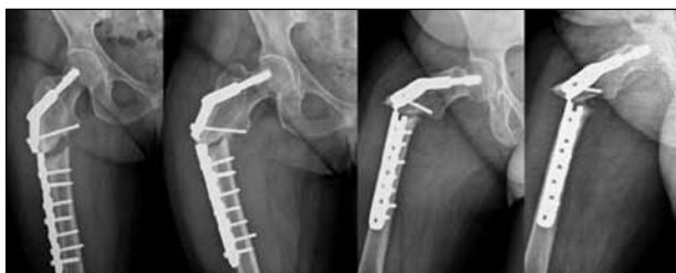
▲ Figura 7. Radiografías de cadera derecha. Pseudoartrosis asociada a falla del material de osteosíntesis. Se destaca la falta de consolidación típica de las fracturas por bifosfonatos, manteniendo bien visibles sus características iniciales, como la espícula medial. Se observa también cómo el material de osteosíntesis se fatigó a nivel del orificio que pasa por el foco fracturario. No se detectan signos de aflojamiento del tornillo cefálico ni de los tornillos de la placa.

Fue dada de alta con cuidados domiciliarios y fue controlada clínica y radiológicamente a los 15, 45, 90 y 180 días de la cirugía. A los 6 meses de seguimiento, la paciente deambulaba sin asistencia, sin dolor y se constató la consolidación de la fractura en las radiografías (Figuras 9 y 10). El fémur contralateral no provoca síntomas y los estudios por imágenes no muestran un franco avance de la patología, por lo que se mantiene una conducta expectante.