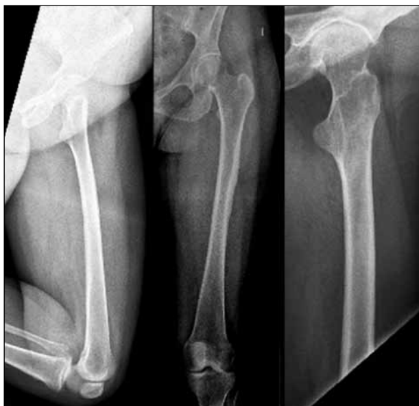
► Figura 10. Radiografía de fémur derecho (fémur contralateral). Mínimo engrosamiento de la cortical femoral.