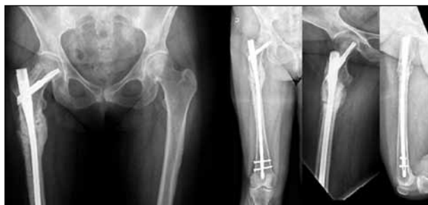
▲ Figura 9. Radiografías de fémur derecho. Control al mes 6 de la cirugía. Nótese la consolidación de la fractura.