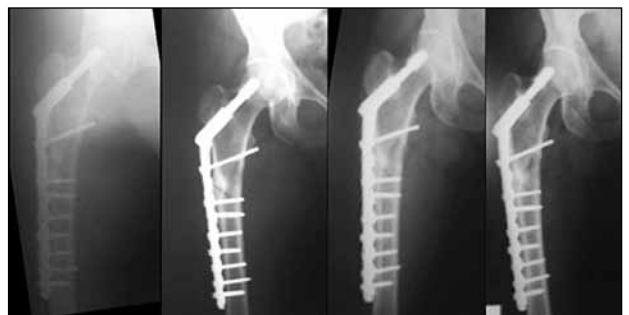
Figura 5. Radiografías de fémur derecho. Posoperatorio inmediato. Reducción y osteosíntesis con placa con tornillo deslizante. Se destaca la posición del tornillo cefálico en el tercio superior del cuello femoral.

Figura 6. Controles radiológicos posoperatorios a los 2, 4, 6 y 10 meses.