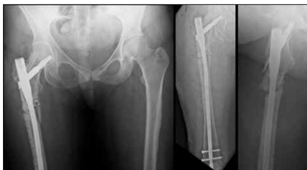
▲ Figura 8. Radiografías de cadera y fémur derecho. Imágenes del posoperatorio inmediato de la cirugía de rescate. Se observa un clavo cervicodiafisario con injerto autólogo estructural de peroné y dos bloqueos distales. Se destaca la posición del tornillo cefálico en el tercio inferior del cuello femoral, dejando libre el tercio superior que contiene el injerto óseo.