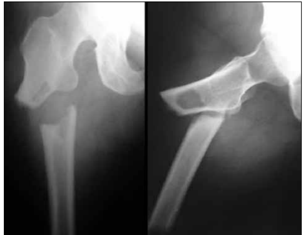
Figura 4. Radiografías de fémur derecho. Fractura subtrocantérica atípica por bifosfonatos. Nótese la típica ubicación subtrocantérica, el trazo transvers u oblicuo corto, la espícula medial y el engrosamiento de la cortical femoral.