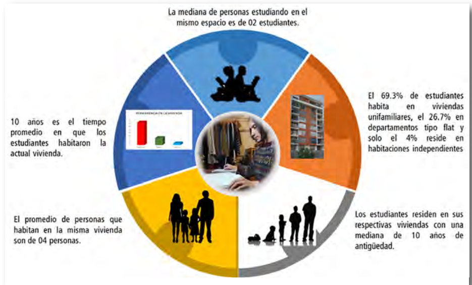
Figura 1. Características personales.

Se deben pensar espacios de producción agrícola (tierra), dentro del programa arquitectónico, que no se queden como elementos decorativos en fachadas, sino que resulten como espacios de relajación y producción para sus habitantes.