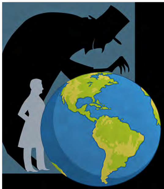
Figura 1. Ilustración modificada de la portada del libro "El extraño caso del Dr. Jekyll y Mr. Hyde" (2015). Editorial Austral, pp.208

Una cuestión más del Antropobimores es su composición