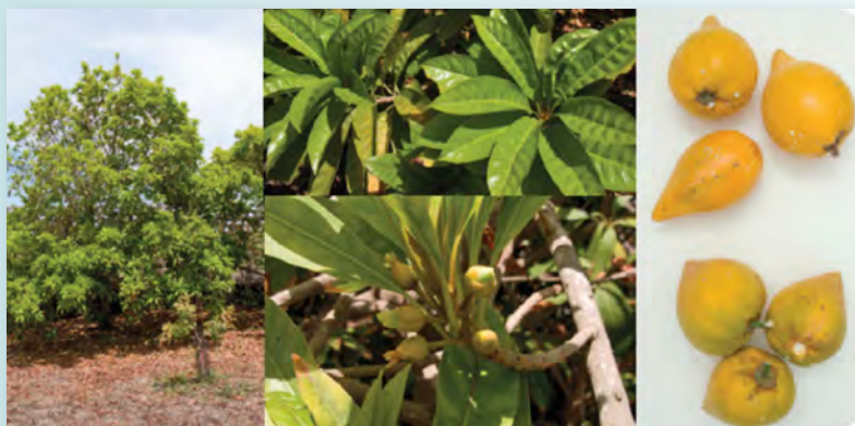
Figura 1. Características del árbol, flores y fruto del Zapote amarillo ( Pouteria campechiana ). (Instituto Canario de Investigaciones Agrarias (ICIA), 2013).

Palabras Clave: antioxidantes, polifenoles, Pouteria campechiana .