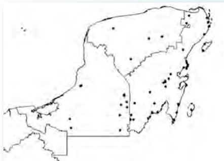
Figura 2. Distribución de la especie del Zapote amarillo ( Pouteria campechiana ) (CICY,2010).

año 11, no. 18 julio - diciembre del 2021