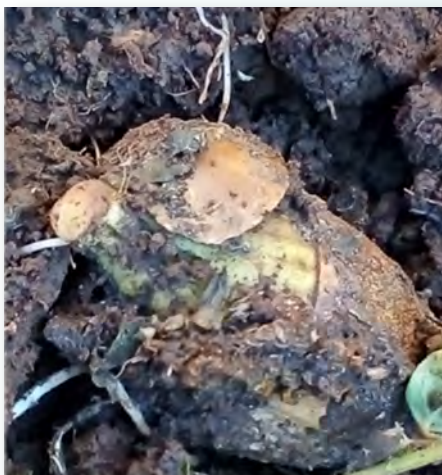
Figura 3. Semilla del Zapote amarillo, germinando. (Elaboración propia).

El Servicio de Información Agroalimentaria y Pesquera (SIAP), realiza un seguimiento a los frutos del zapote que se producen en México, donde se reporta que Campeche es el estado líder, el cual obtiene un 43.0% de la producción (SIAP, 2017).