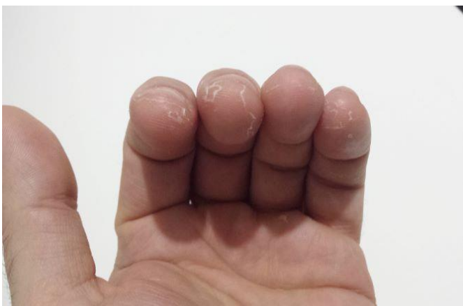
Figura 1: Sequedad y descamación fina difusa en dedos de la mano izquierda por uso repetido de solución hidroalcohólica.

higienización de las manos de forma repetida, justificada por una intensa actividad sanitaria mediante técnica por fricción con un preparado de base alcohólica. En todos los casos, la dermatitis de contacto fue simple no irritativa, y se caracterizó por sequedad, descamación epidérmica y leve picazón en yema de los dedos y palmas de una o ambas manos ( Figuras 1, 2 y 3 ).