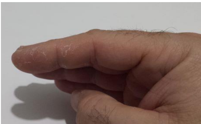
Figura 3: Visión lateral de la sequedad y descamación en dedo índice (2º dedo) de la mano derecha.

Tras la notificación de los casos a la Unidad de Prevención de Riesgos Laborales (UPRL), no fue necesario realizar interconsulta dermatológica, consistiendo el tratamiento en evitar todo lo posible el contacto con las soluciones hidroalcohólicas que provocaron la reacción. Únicamente se aplicó a la zona un ligero lavado de manos con agua y jabón neutro e hidratación 3 veces al día (crema protectora de manos).