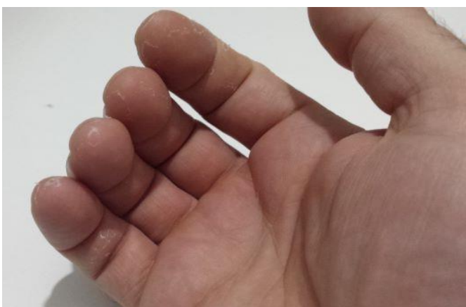
Figura 2: Sequedad y descamación fina difusa en dedos de la mano derecha por uso repetido de solución hidroalcohólica.