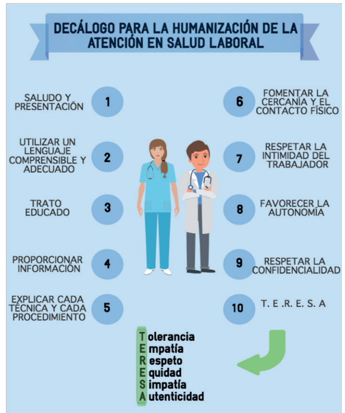
Figura 1. Decálogo para la humanización de la atención en salud laboral.