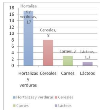
Figura 1: Datos de tabulación acerca de los tipos de alimentos. Mayo – Julio 2015

mayoría a la agricultura las cosechas obtenidas son su principal fuente de alimentación, por lo que al consumir una alta cantidad de hortalizas y verduras están expuestos a mayores riesgos en cuanto a enfermedades parasitarias se refiere. A través de la encuesta realizada se obtuvo como resultado que un 58% de la población tiene como alimento principal las hortalizas y verduras y tan solo un 4% consume lácteos, lo que indica además que la dieta consumida no es muy equilibrada y esto afecta principalmente al desarrollo los niños.