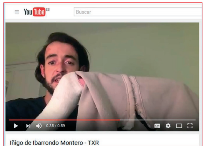
Imagen 1. Proyecto TXR https://youtu.be/dYx_zxeG57g

Actualmente la prevención de úlceras por presión (UPP), se basa en la evaluación de los factores de riesgo, la planificación de cuidados preventivos y la monitorización periódica de los cambios tisulares mediante evaluación visual de la piel, cuya variabilidad depende en gran medida, de la habilidad y experiencia del profesional que realiza la valoración.