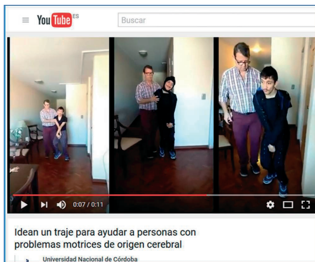
Imagen 3. El traje inflable. https://youtu.be/MLJsUsXLkwc