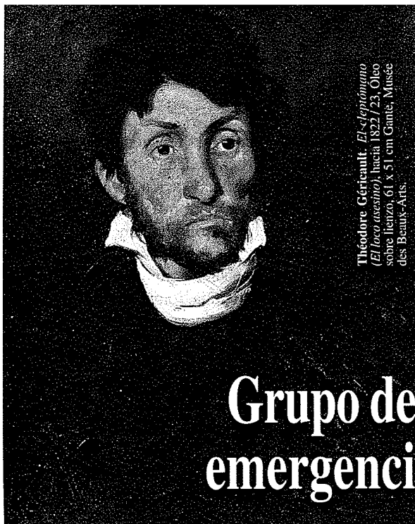
Théodore Géricault. El cefalópodo ( El loco asesino ), hacia 1822/23, óleo sobre lienzo, 61 x 51 cm. Musée des Beaux-Arts.