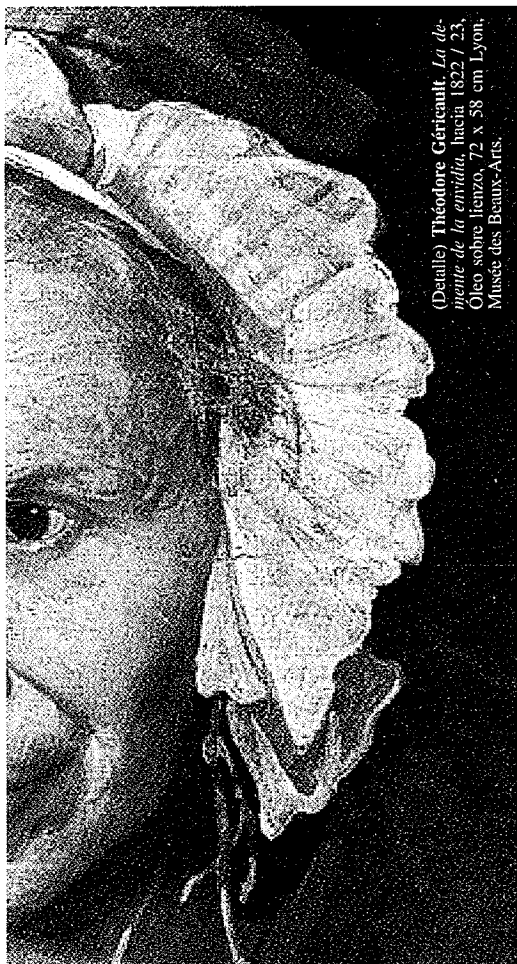
(Detalle) Théodore Géricault. La ahogada de la envidia , hacia 1822 / 23. Oleo sobre lienzo, 72 x 58 cm Lyon, Musée des Beaux-Arts.

ten o actúan de manera distinta. Esta exclusión es una de las causas del desplazamiento forzado que, de acuerdo con los datos del Observatorio de la Violencia de la Personería de Medellín, entre octubre de 1998 y diciembre de 2000 alcanzaba la cifra de 29.982 personas.