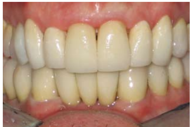
Figura 6. prótesis definitiva

Posteriormente se coloca prótesis fija definitiva, con una excelente aceptación estética y funcional por parte del paciente. Figura 6.