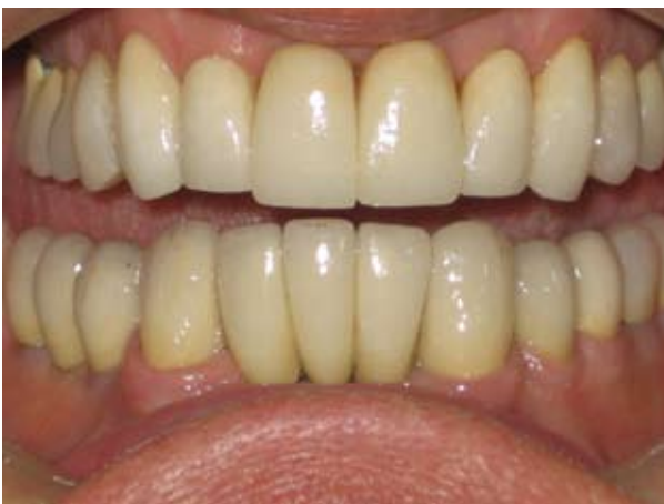
Figura 3. Coronas individuales en 11 y 21, carillas en 12, 13, 22, 23

El plan de tratamiento a seguir fue: coronas libres de metal en 11 y 21, carillas en 12, 13, 22, 23. Figura 3.