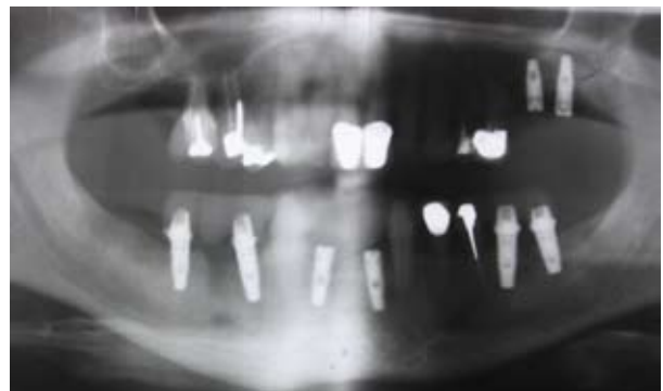
Figura 5. Regeneración ósea positiva

Se realiza la toma de impresiones definitivas y colocación de pilar. Radiografía Panorámica de control en donde se observa regeneración ósea positiva y biocompatibilidad entre hueso e implante. Figura 5.