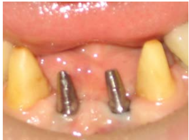
Figura 4. Cicatrización de tejidos blandos

Tres meses después fue retirado el provisional se conserva Figura 4.