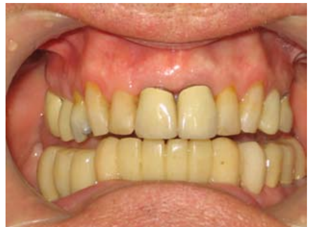
Figura 1. Estado inicial del paciente

Paciente masculino de 45 años de edad que consulta a rehabilitación oral por presentar inconformidad estética y funcional preocupado por su estado de salud oral decide recurrir al profesional de la salud oral. Respecto a sus antecedentes médicos familiares y personales no reportó datos de relevancia alguna. Durante el examen intraoral fig. 1: se observan coronas desadaptadas, encía enrojecida e inflamada, prótesis fija antero inferior desadaptada.