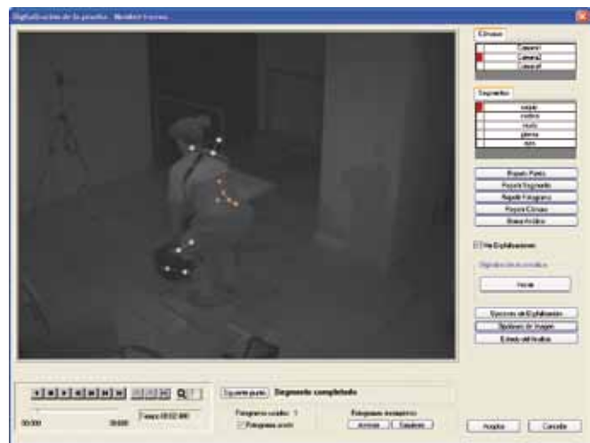
Figura 3. Digitalización semiautomática (Kinescan/IBV V04/V08).