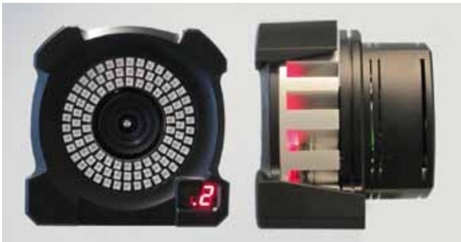
Figura 2. Cámara digital de 250 fps con preprocesado y foco incorporado (Kinescan/IBV V11).

posiciones de los segmentos corporales de forma totalmente automática y en tiempo real. Así, el usuario puede disponer, inmediatamente después de la realización del gesto, de los datos relativos a las posiciones de puntos, segmentos corporales y articulaciones, y de las variables cinemáticas y dinámicas derivadas. Es posible realizar un análisis 3D completo de los movimientos humanos de forma rápida y sencilla gracias a las nuevas prestaciones del sistema.