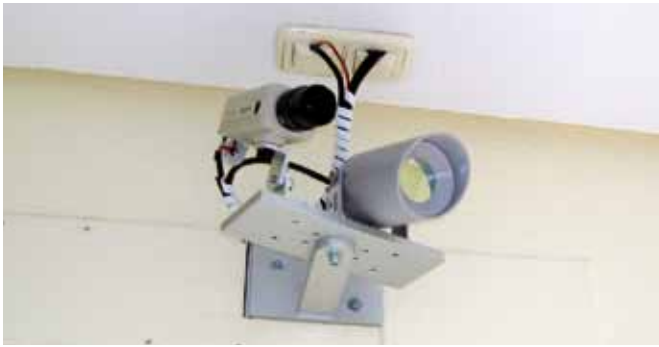
Figura 1. Cámara analógica de 25 fps y foco halógeno (Kinescan/IBV V04).