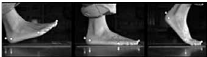
Figura 2. Movimiento natural de flexión del pie.

> El sistema incluye dos ejes de flexión con un diseño asimétrico. Uno de ellos, el más alejado de la punta del zapato, tiene como objetivo potenciar al máximo la flexión dorsal del antepié. El más cercano a la punta del zapato persigue favorecer el despegue de los dedos. Estos dos ejes están más separados en la parte externa del pie que en la interna para favorecer una flexibilidad progresiva durante el paso. En ambos casos, el calzado ha de ser lo suficientemente flexible, respetar el movimiento natural del pie y propiciar que la fuerza de impulso esté orientada en la misma dirección de la marcha (Figura 2). Asimismo, este sistema mejora el agarre del zapato al suelo al andar, especialmente en el calzado con suela de cuero, disminuyendo el riesgo de caídas y lesiones, si bien es aplicable también a suelas de goma, TPU, TR o EVA inyectada.