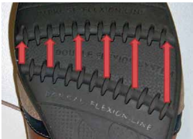
Figura 3. Sistema de flexión desarrollado que incluye dos ejes de flexión con un diseño asimétrico.

Para generar el diseño de la región de máxima flexibilidad en el antepié, se han utilizado las bases de datos de medidas antropométricas de pies de la población masculina y femenina de las que dispone el IBV, determinando la posición de ambos ejes de flexión, su orientación, la variabilidad que hay entre usuarios así como la variación que sufre la geometría estática del pie al caminar. El diseño de la región de flexión se ha realizado de forma que es más corta en la parte interna de la suela que en la zona externa, proporcionando una flexibilidad progresiva durante el paso: la línea de flexión de la suela va progresando desde su parte inferior a su parte superior, de tal manera que en la parte externa del calzado lo hace a una velocidad mayor, imitando y favoreciendo de esta manera el movimiento natural del pie (Figura 3).