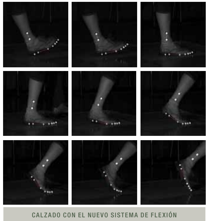
Figura 4. Paso realizado utilizando un calzado que incluye el nuevo sistema de flexión registrado mediante el equipo de fotogrametría.

Para evaluar la influencia del calzado en el movimiento natural del pie y comprobar el correcto funcionamiento de los dos ejes de flexión propuestos, se ha realizado un análisis con personas empleando la técnica de fotogrametría que analiza el movimiento al caminar (Figura 4).