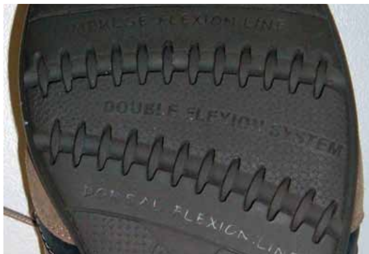
Figura 1. Sistema de flexión desarrollado.

El nuevo sistema consta de una serie de hendiduras que se han adaptado al eje natural de flexión del pie para mejorar la flexibilidad del calzado al caminar o realizar la actividad diaria. Además, se han incluido unos tensores perpendiculares a las líneas de flexión cuya misión es recuperar completamente su forma original una vez se supere el punto de máxima flexión (Figura 1). Esto evita que el calzado se deforme progresivamente a causa de su uso, especialmente en la zona del antepié, debido a la flexión continuada que se produce en esta zona al caminar.