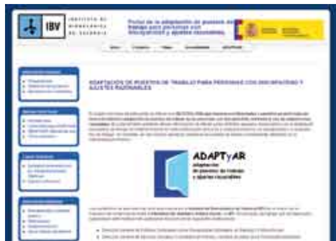
Figura 1. Web del proyecto ADAPTYAR.

Los resultados obtenidos en el proyecto están recogidos en un portal web al que puede accederse desde la siguiente dirección: http://adaptyar.ibv.org .