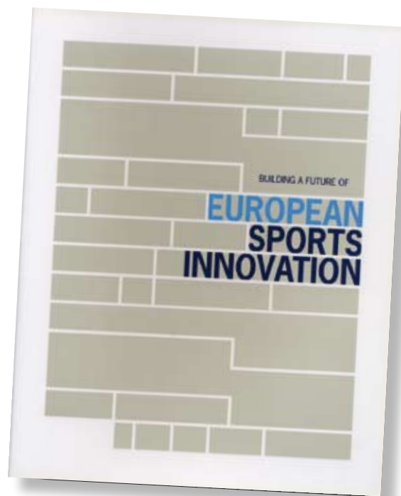
Figura 3. Publicación de INNOSPORT.

Se ha dado un paso muy importante para el ámbito del deporte con la creación de esta plataforma, que supone la punta de lanza de la innovación en la industria del deporte. En ella el IBV, como socio fundador y miembro activo de los grupos de trabajo constituidos, tendrá un papel protagonista en las decisiones estratégicas, actuando, a su vez, como tractor para todo el sector industrial español. ●