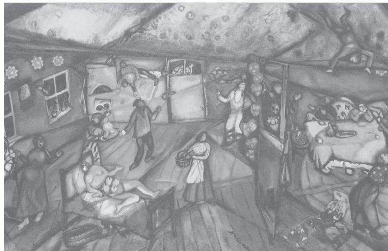
Marc Chagall. El nacimiento, 1912.