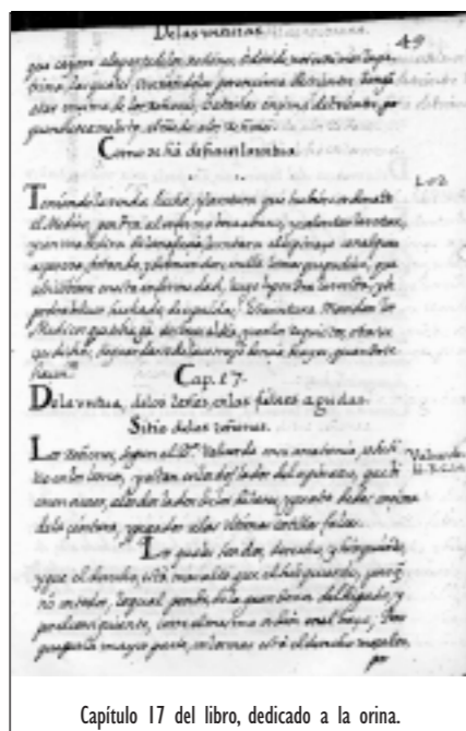
Capítulo 17 del libro, dedicado a la orina.