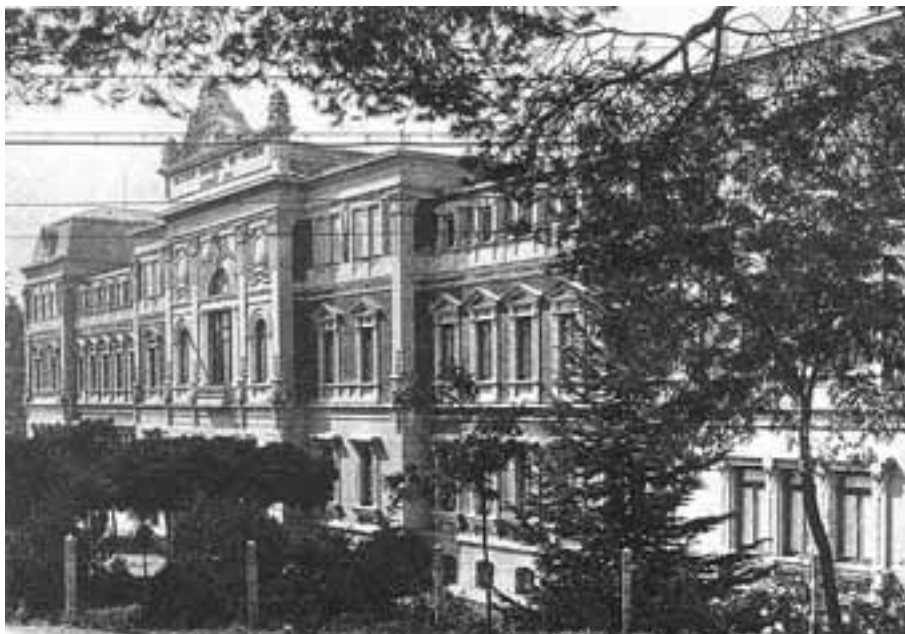
Instituto Nacional de Higiene, Alfonso XIII (el Alfonso)