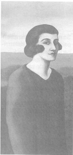
RENÉ MAGRITTE, (detalle) La invención de la vida , 1927 Óleo sobre lienzo, 80 x 116 cm. Brasélas, colección privada.