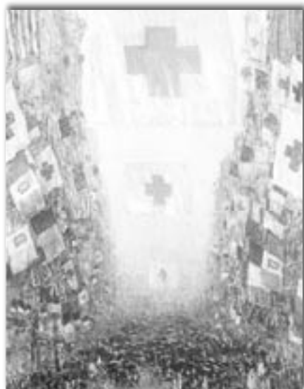
Childe Hassam. El Día de la Celebración. 1918. Tela, 90,2 x 59,7 cm Christopher T. May, depositario de Sterling, Meredith y Laura May.