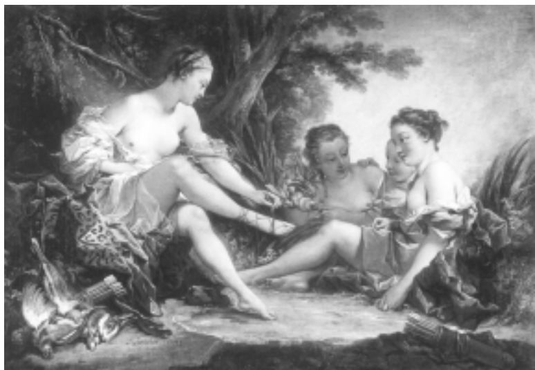
François Boucher. Diana de vuelta de la caza, 1745. Óleo sobre lienzo, 94 x 132 cm París, Musée Cognacq-Jay

El fin de la promoción de la resiliencia es desarrollar la capacidad humana de enfrentar, sobreponerse y ser fortalecido, e incluso transformado, por las experiencias de adversidad. En este sentido, la promoción de la resiliencia, al igual que la promoción de la salud, “no es tarea de un sector determinado”